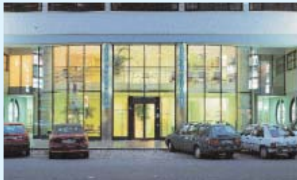
augenzentrum Prof. Zirm in Innsbruck

Zapraszamy w Państwa imieniu wszystkie niezbędne procedury: