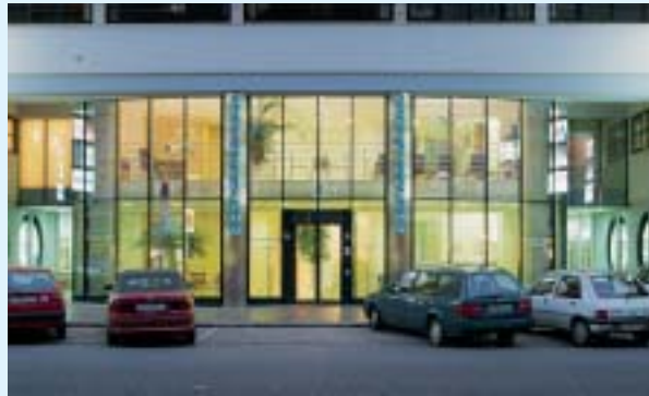
augenzentrum Prof. Zirm v Innsbrucku

Oční klinika prof. Zirma v Innsbrucku Zabezpečíme pro Vás všechny důležité kroky prostřednictvím našeho centrálního koordi- načního oddělení