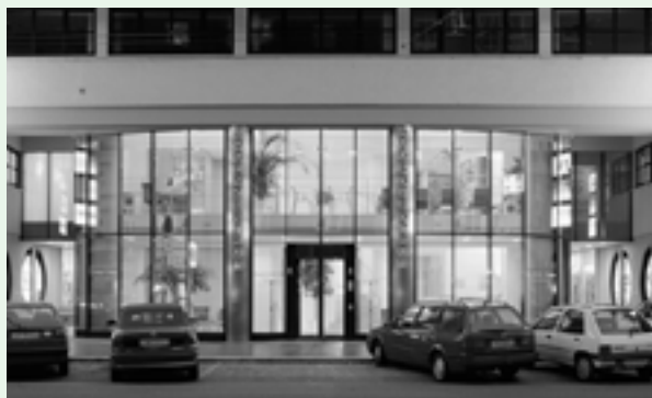
augenzentrum Prof. Zirm in Innsbruck